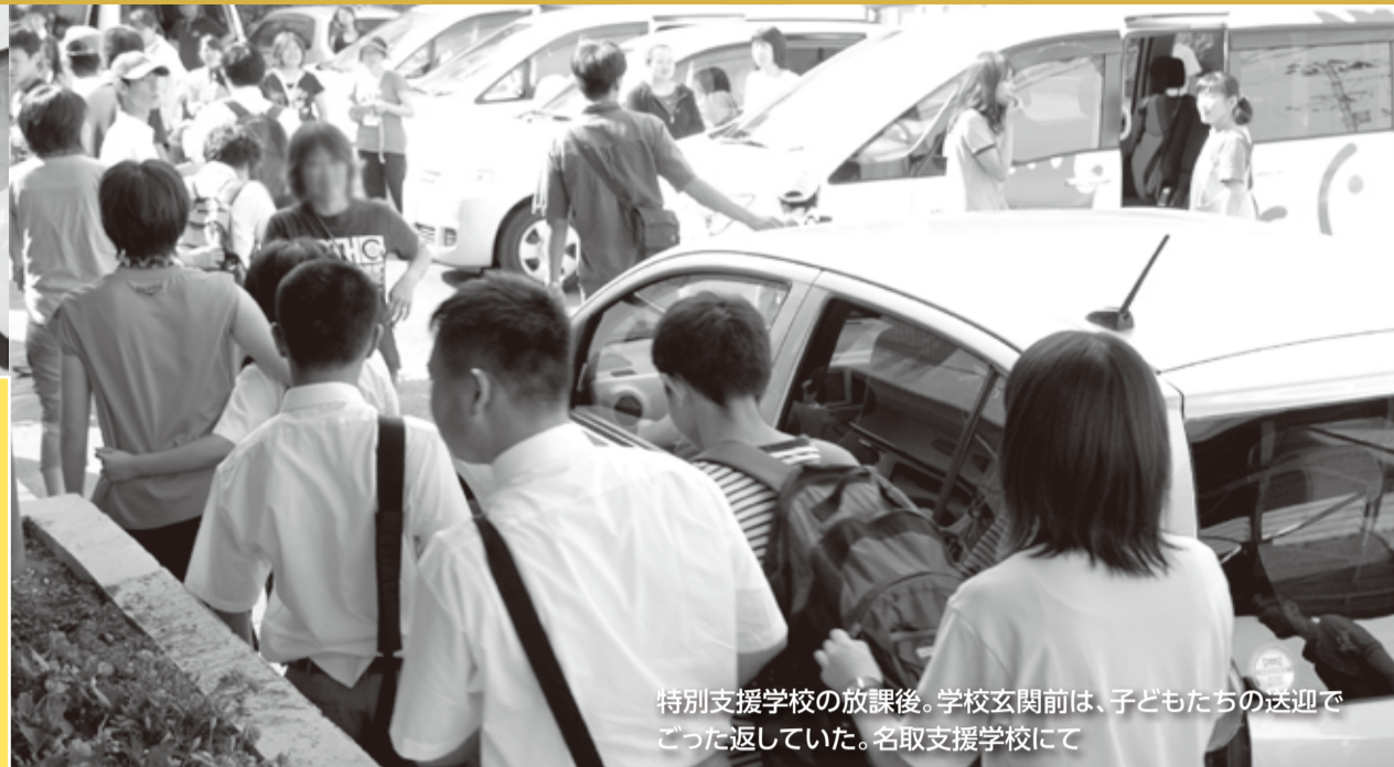
特別支援学校の放課後。学校玄関前は、子どもたちの送迎でごった返していた。名取支援学校にて

子どもの貧困 「こども食堂」が各地に生まれている。民間団体が取りこんでいるもの。食費もままならない家庭が救われている。子どもの貧困の解決は、市政でも重要課題だ。