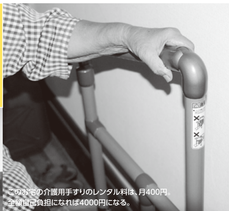
このお宅の介護用手すりのレンタル料は、月400円。全額自己負担になれば4000円になる。

急患センターでなにが 休日・夜間もフル回転し、年間3万人以上を受け入れる市急患センター。ところが看護師は全員非正規雇用だ。命を救う現場にも“安あがり”が忍び寄る。共産党は、正規雇用を求めた。