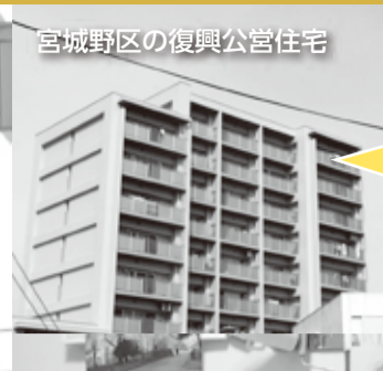
宮城野区の復興公営住宅

被災者の家賃負担 復興公営住宅や民間賃貸住宅の家賃が被災者にズシリと重い。国も市も、見て見ぬふりだ。復興・生活再建の道のりは長い。