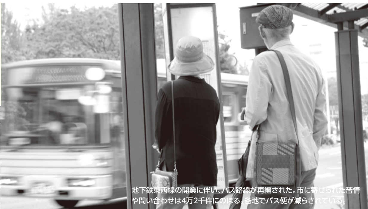
地下鉄東西線の開業に伴い、バス路線が再編された。市に寄せられた苦情や問い合わせは4万2千件にのぼる。各地でバス便が減らされている。

保育所入所の大変さ 認可保育所を希望しても入れない児童は1000人以上。ところが市は、今議会に公立保育所2ヶ所の廃止を提案(将監西、八乙女)。可決された。共産党は、保育所廃止に反対し、認可保育所の増設を迫った。