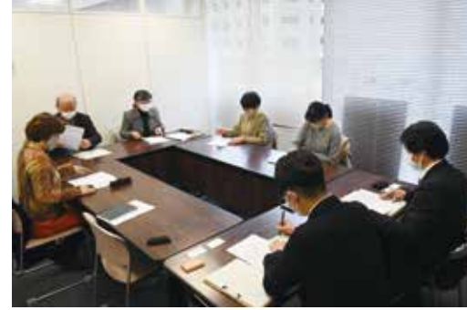
名簿の一括提供はすべきではないと、市民団体とともに繰り返し申し入れ

そもそも、この間の集団的自衛権行使容認や安保法制の制定、敵基地攻撃能力の保有や安保3文書の閣議決定など、自衛隊が武力行使を命じられる現実性はより高まっていると指摘して、市が名簿を提供し、自衛隊に入隊した若者の命や人権は守られると胸を張って言えるのか。名簿の提供は再検討し、撤回をすべきと強く求めました。